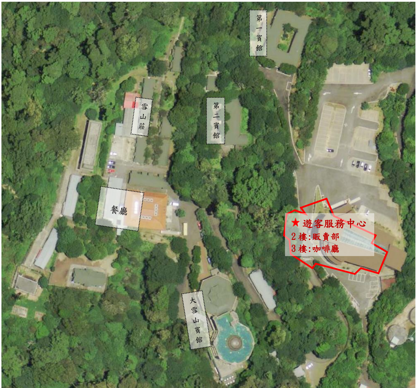
附件一、43k 遊客服務中心販賣部及咖啡廳位置圖