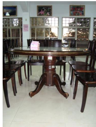
圖 2：餐桌（木頭支架），30 張