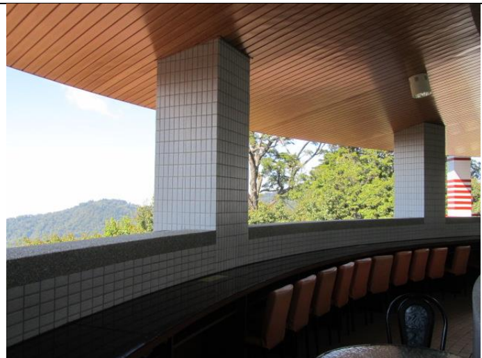
咖啡廳弧形陽台(3樓)2