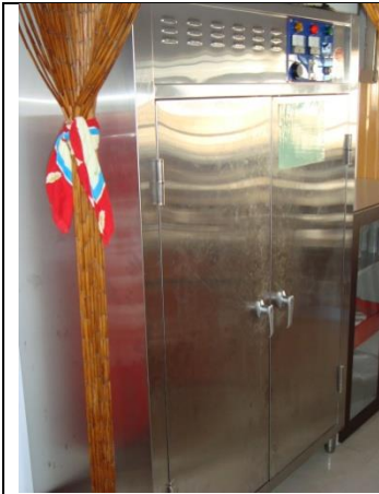
圖 1：烘碗機，1 台