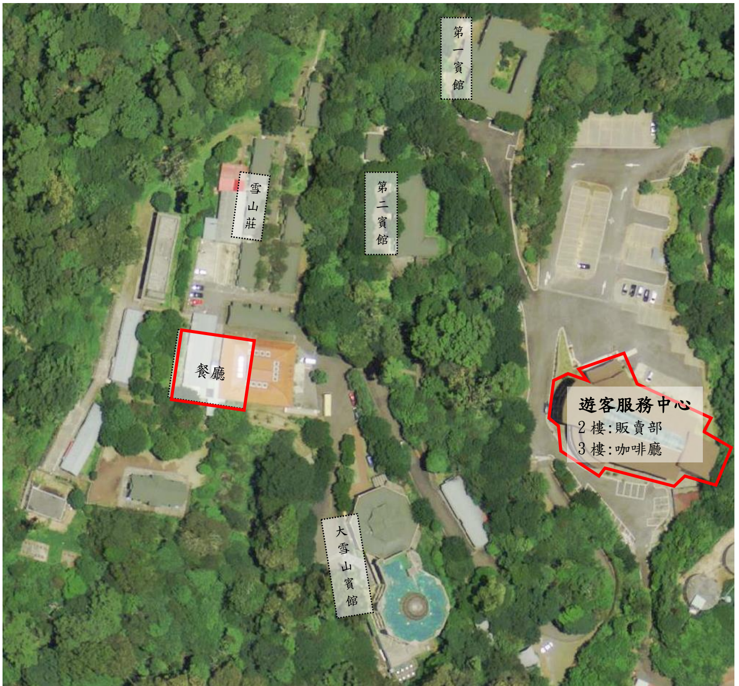
附件一、大雪山國家森林遊樂區 43K 餐廳、販賣部及咖啡廳位置圖