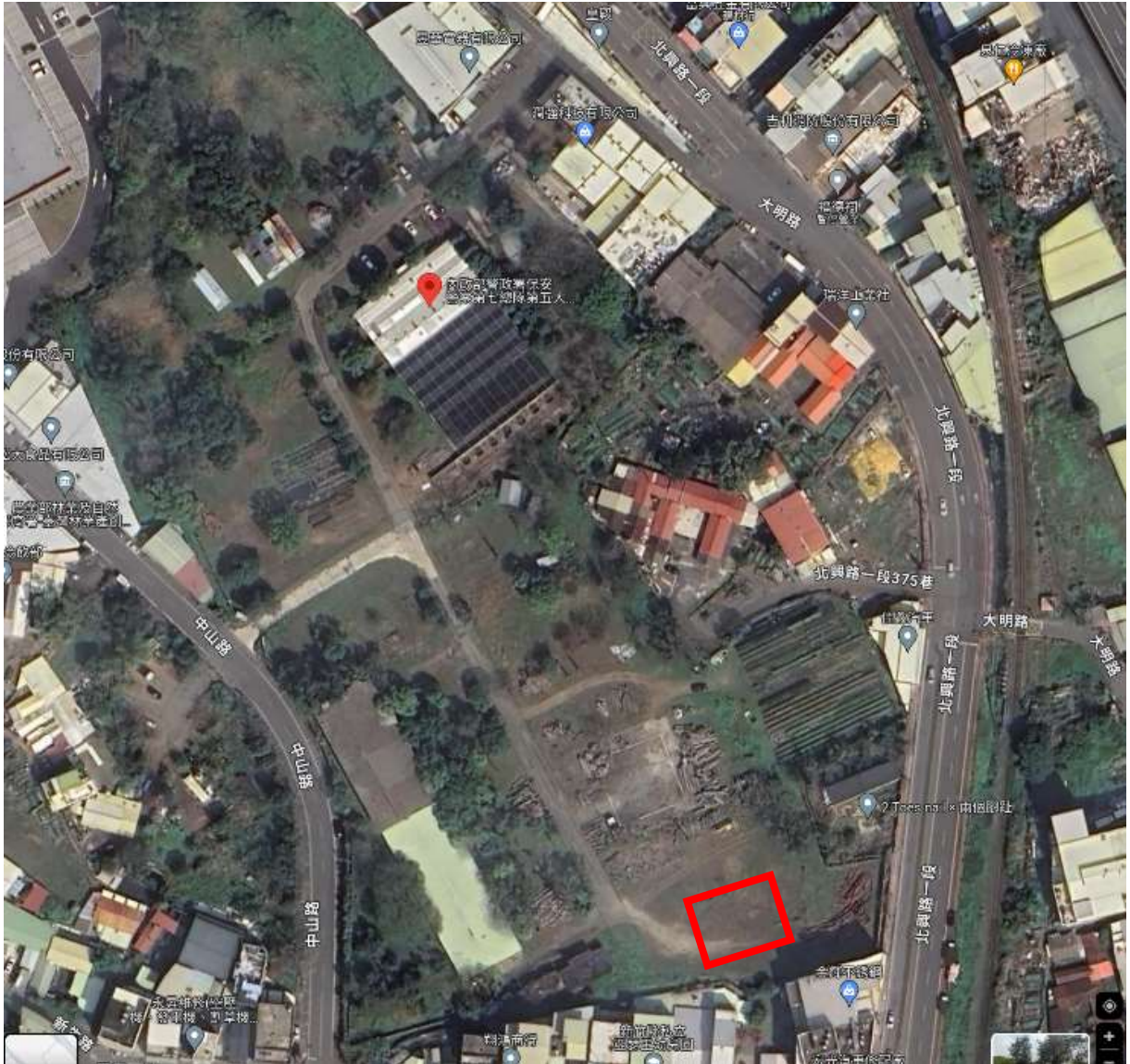
地點：新竹分署竹東貯木場