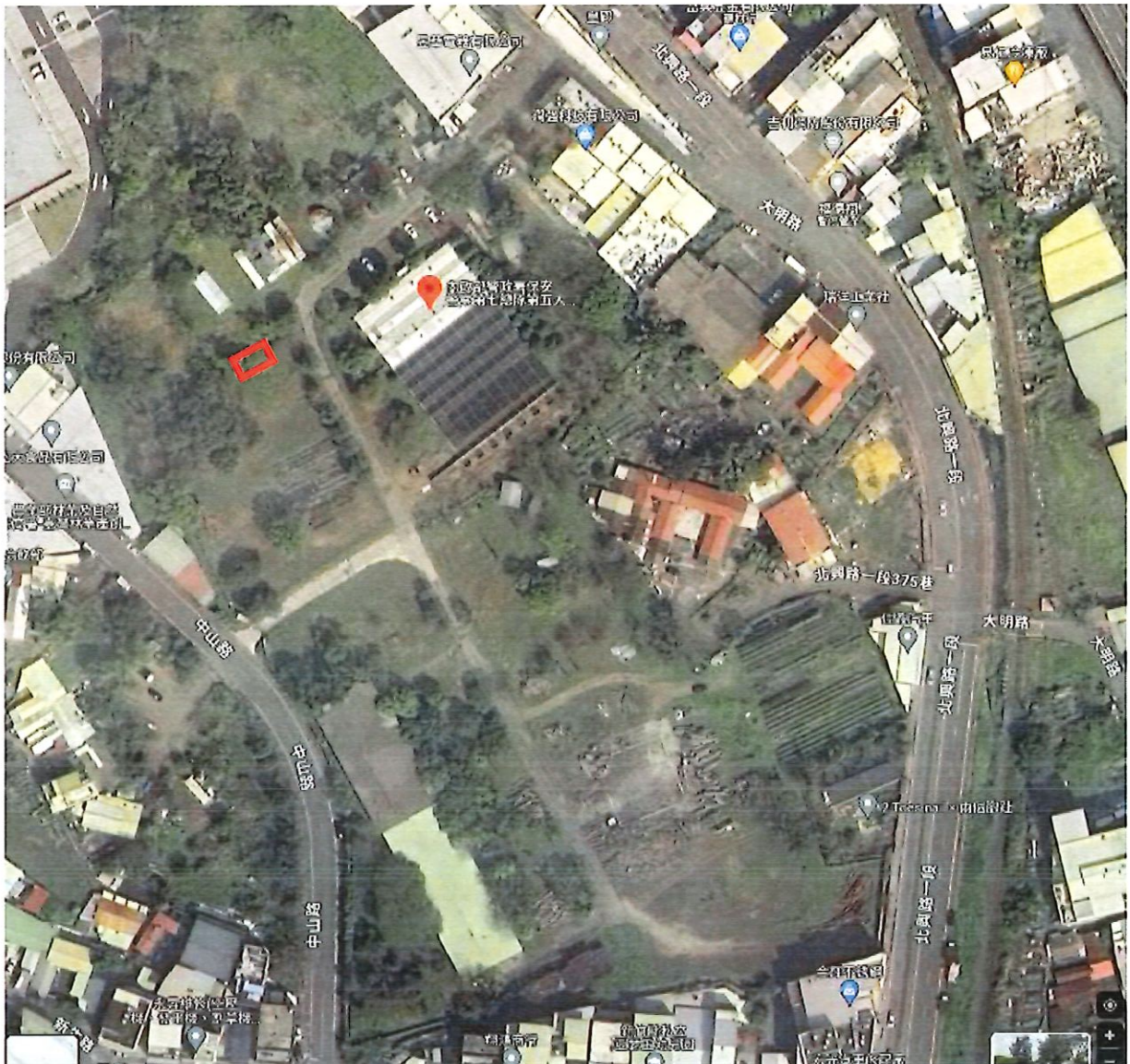
地點：新竹分署竹東貯木場