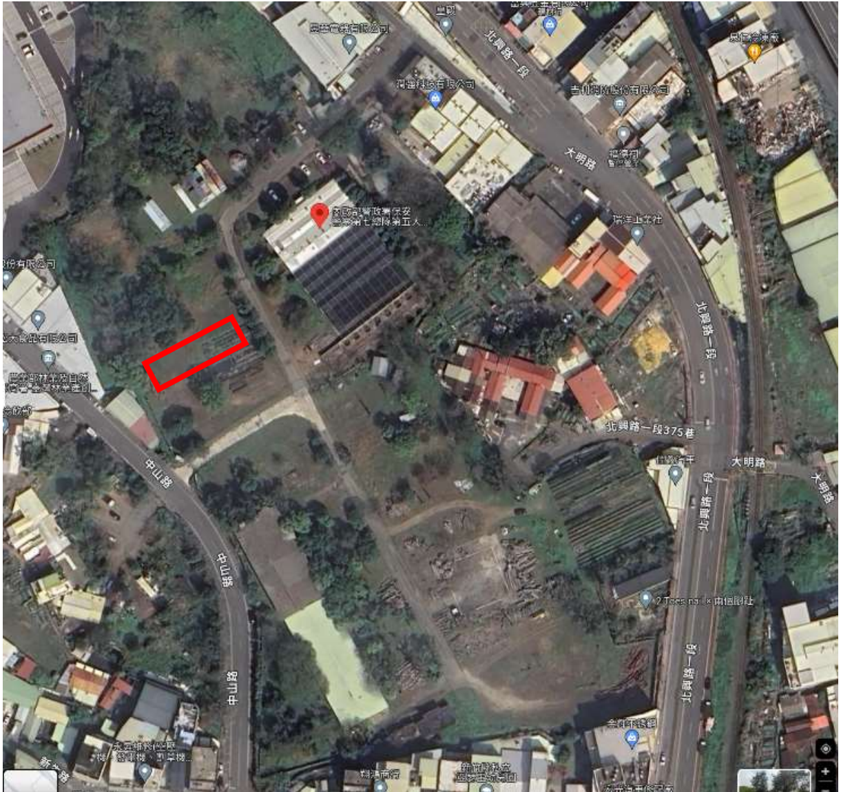
地點：新竹分署竹東貯木場